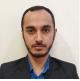
پژوهشگر اندیشکده حقوق بشر و شهروندی دانشگاه امام صادق علیه السلام