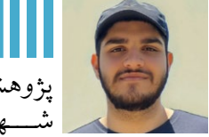
پژوهشگر اندیشکده حقوق بشر و شهروندی دانشگاه امام صادق علیه السلام