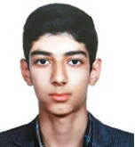
پژوهشگر اندیشکده حقوق بشر و شهروندی دانشگاه امام صادق علیه‌السلام