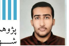
پژوهشگر اندیشکده حقوق بشر و شهروندی دانشگاه امام صادق علیه السلام