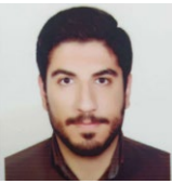
پژوهشگر اندیشکده حقوق بشر و شهروندی دانشگاه امام صادق علیه السلام