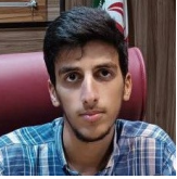
پژوهشگر اندیشکده حقوق بشر و شهروندی دانشگاه امام صادق علیه‌السلام