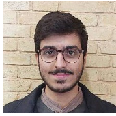
پژوهشگر اندیشکده حقوق بشر و شهروندی دانشگاه امام صادق علیه‌السلام

حمله به آمبولانس‌ها، بیمارستان‌ها، المعمدانی و کادر درمان در تهاجم اخیر رژیم صهیونیستی، طبق ماده ۸ اساسنامه دیوان بین‌المللی کیفری جنایت جنگی محسوب می‌شود. با وجود رعایت مواد ۴۱ و ۴۲ کنوانسیون اول ژنو و ۴۳ کنوانسیون دوم ژنو و ماده ۱۸ پروتکل الحاقی توسط کادر درمان غزه.